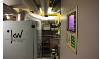
Wärmeverbund, Durlangen Optimierung und Modernisierung