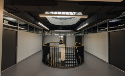
KBSZ, Schwäbisch Gmünd Sanierung und Erweiterung