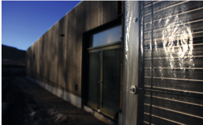
Sporthalle Eschenbach Neubau

Wir sind der erfahrene Partner in der TGA