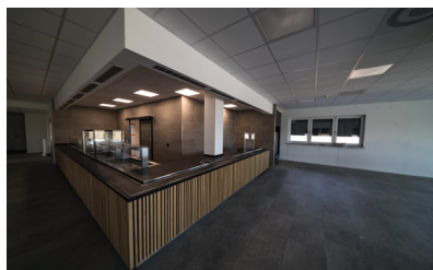
Stadtwerke Schorndorf Neubau