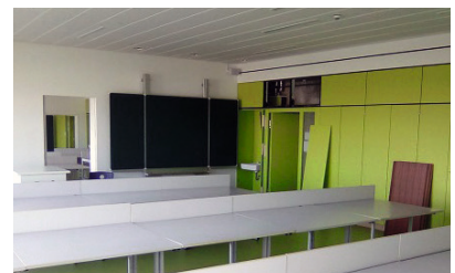
Gewerbliche Schule Kuhberg, Stuttgart Sanierung