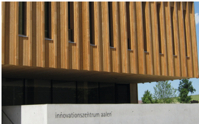
Innovationszentrum, Aalen Neubau