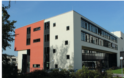
St. Anna-Virngrund-Klinik, Ellwangen Neubau