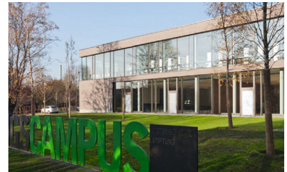
Bildungscampus, Heilbronn Neubau