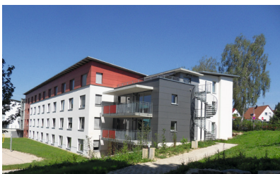
Seminarhaus Schönblick, Schw. Gmünd Neubau