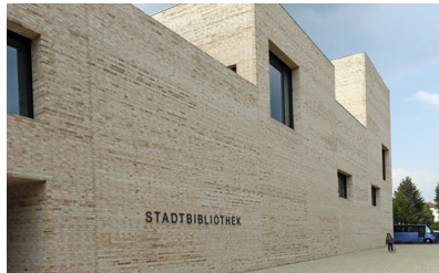
Bibliothek, Heidenheim Neubau