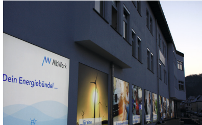
Albwerk, Geislingen Neubau